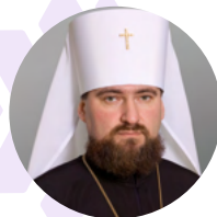
від Митрополита Львівського і Сокальського Димитрія ПЦУ