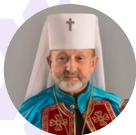
від Митрополита Львівського Владика Ігоря ВОЗЬНЯКА УГКЦ